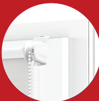
ZAVESENIE NA VEŠIAKY