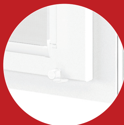
FIXACIA VODIACIM LANKOM